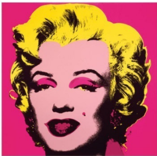
z. B. Portrait in Pop-Art nach Andy Warhol

Wenn ihr Spaß am Zeichnen und Malen, Freude am Farbenspiel und Ausdauer am gestalterischen Arbeiten mitbringt, seid ihr herzlich willkommen. Wir schaffen kleine Kunstwerke zum Verschenken, zum Schmücken z.B. eures Zimmers oder zum Sammeln. Ich freue mich auf eine nette Runde.